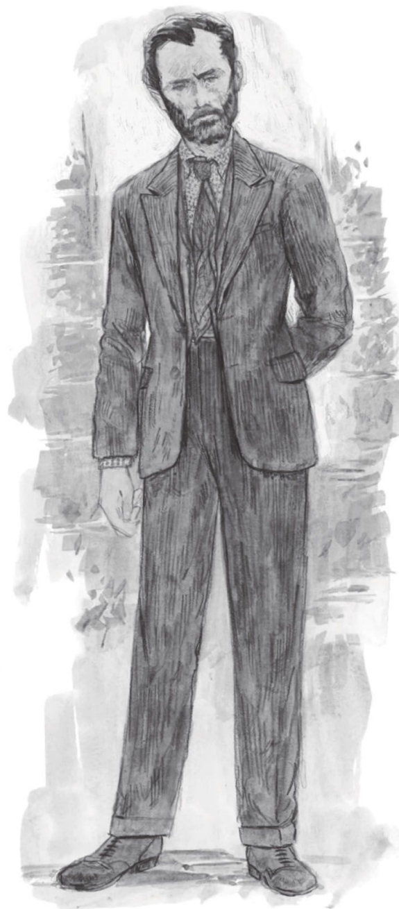
NÁKRES KOSTÝMU ALBUSA DUMBLEDORA

- COLLEEN ATWOODOVÁ ( Dizajnerka kostýmov )