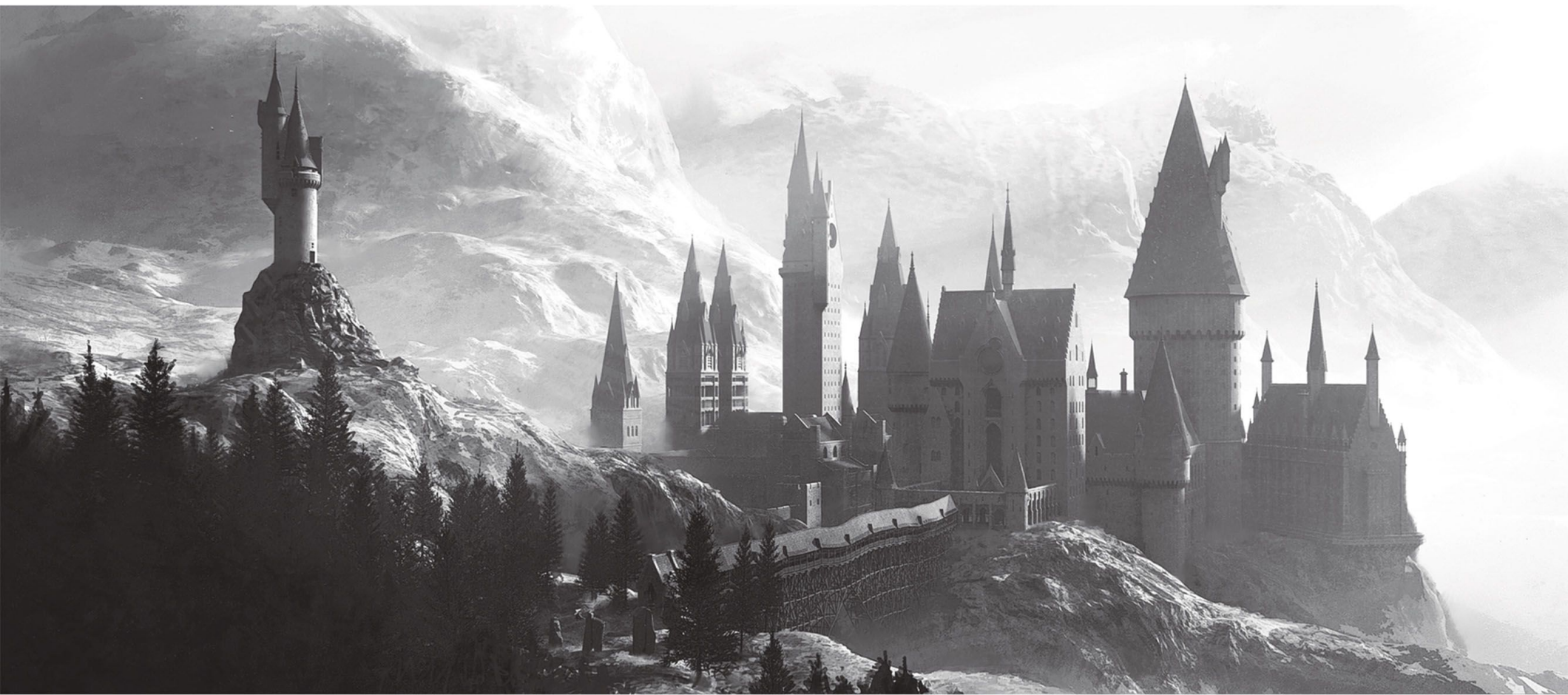
NÁKRES EXTERIÉRU ROKFORTU