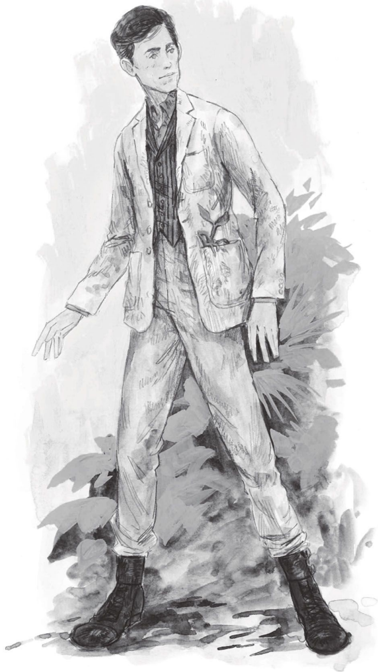
NÁČRTY KOSTÝMOV MLOKA SCAMANDERA