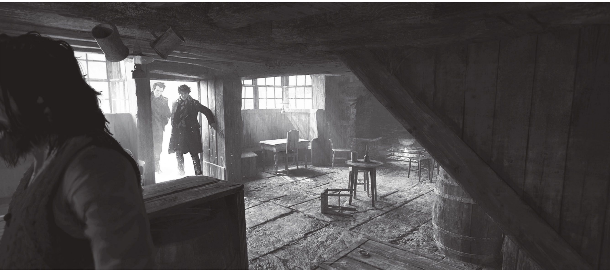
NÁKRES HOSTINCA U KANČEJ HLAVY